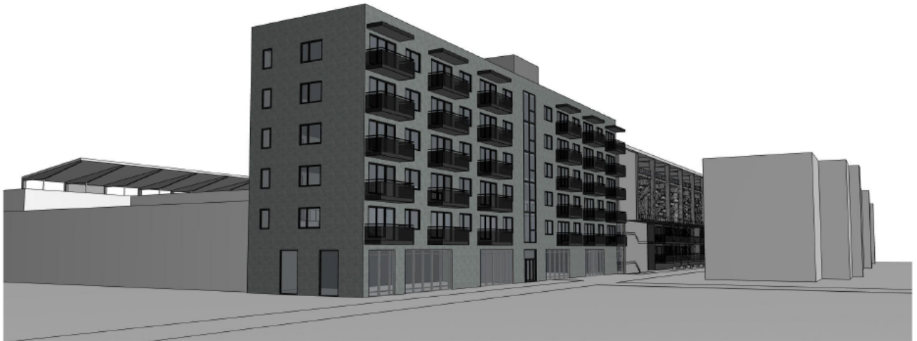
Gate perspektiv, nord vest