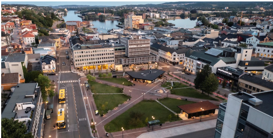
Kollektivknutepunkt og park på Landmannstorget

Snakk byen opp, ikke ned.. mye bra som har kommet, og mer kan det bli.