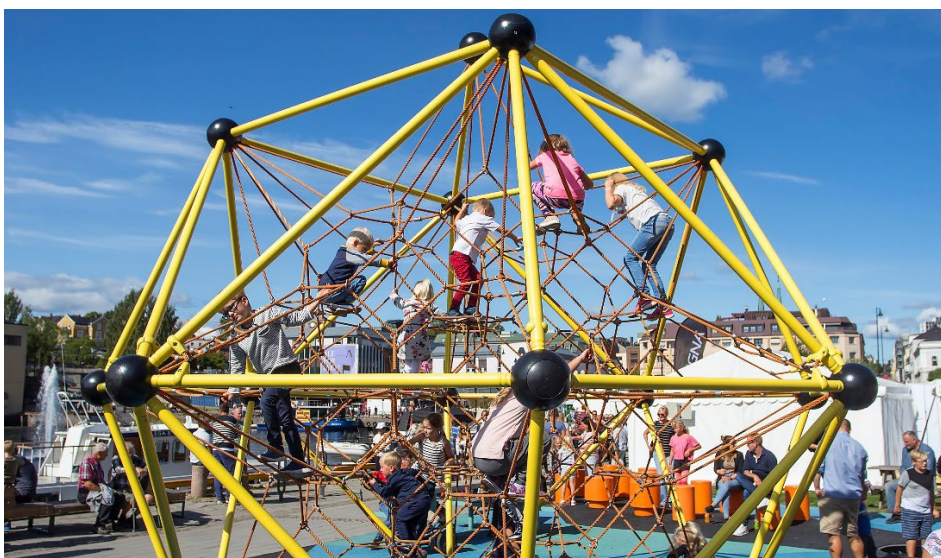
Lekeplass i Bryggeparken