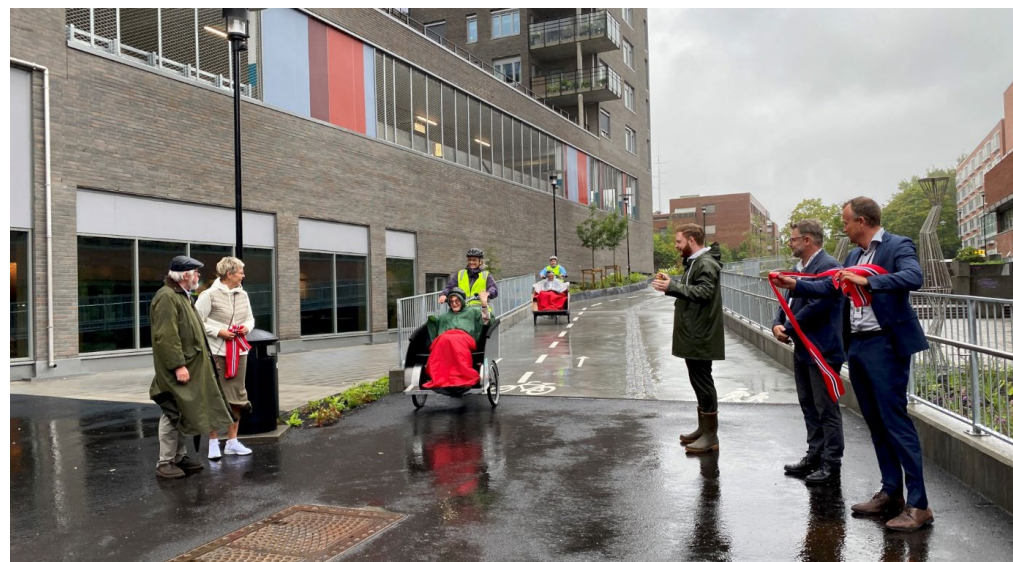
Ny gang, sykkel og flomvei i Kverndalen