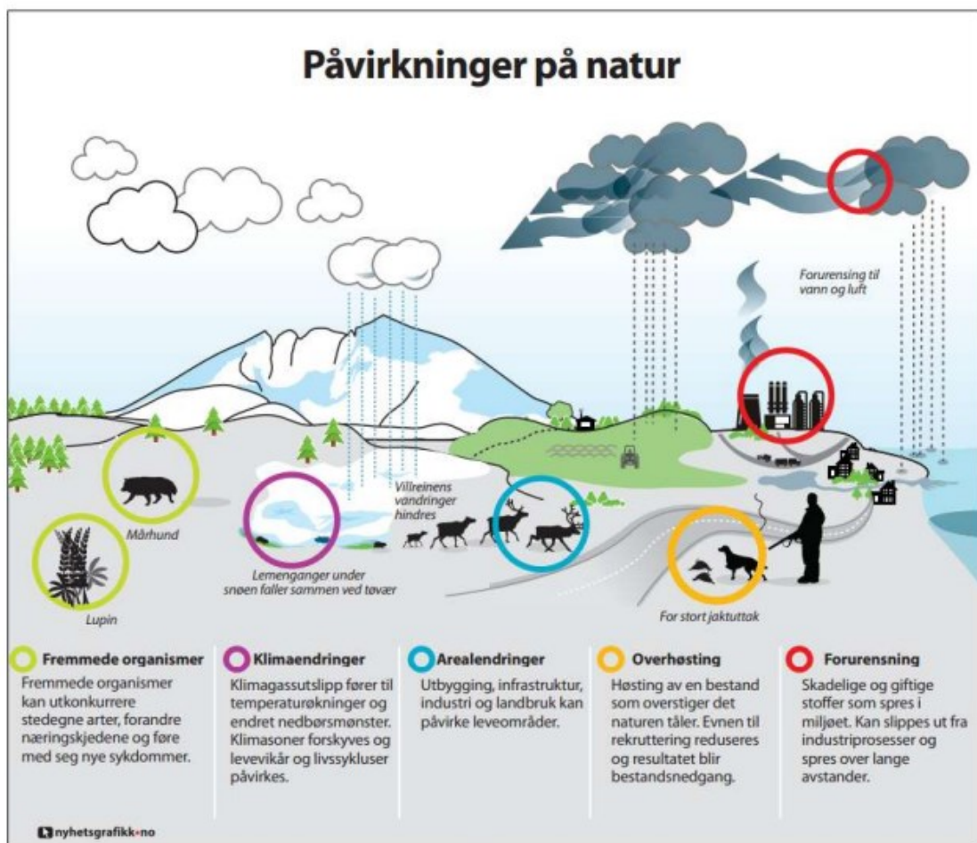
Figur 2: viser påvirkninger på natur. De viktigste er fremmede arter, klimaendringer, arealendringer, overhøsting og forurensning. Kilde: Natur for livet, Meld. St. 14 (2015-2016).

De ulike planene nevnt over kan alle knyttes til temaene som er vist i figuren under.