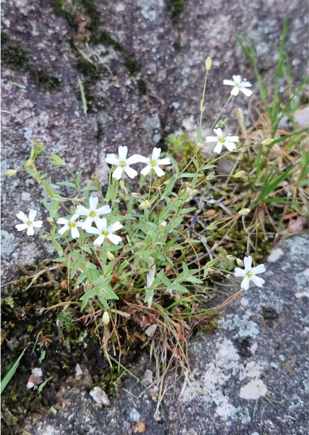
Småsmelle Atocium rupestre er en del av hverdagsnaturen . Svært vanlig art, som vokser på karrig grunnfjell. Ansvarsart for Norge, fordi den her utgjør mer enn 25 % av europeisk bestand.