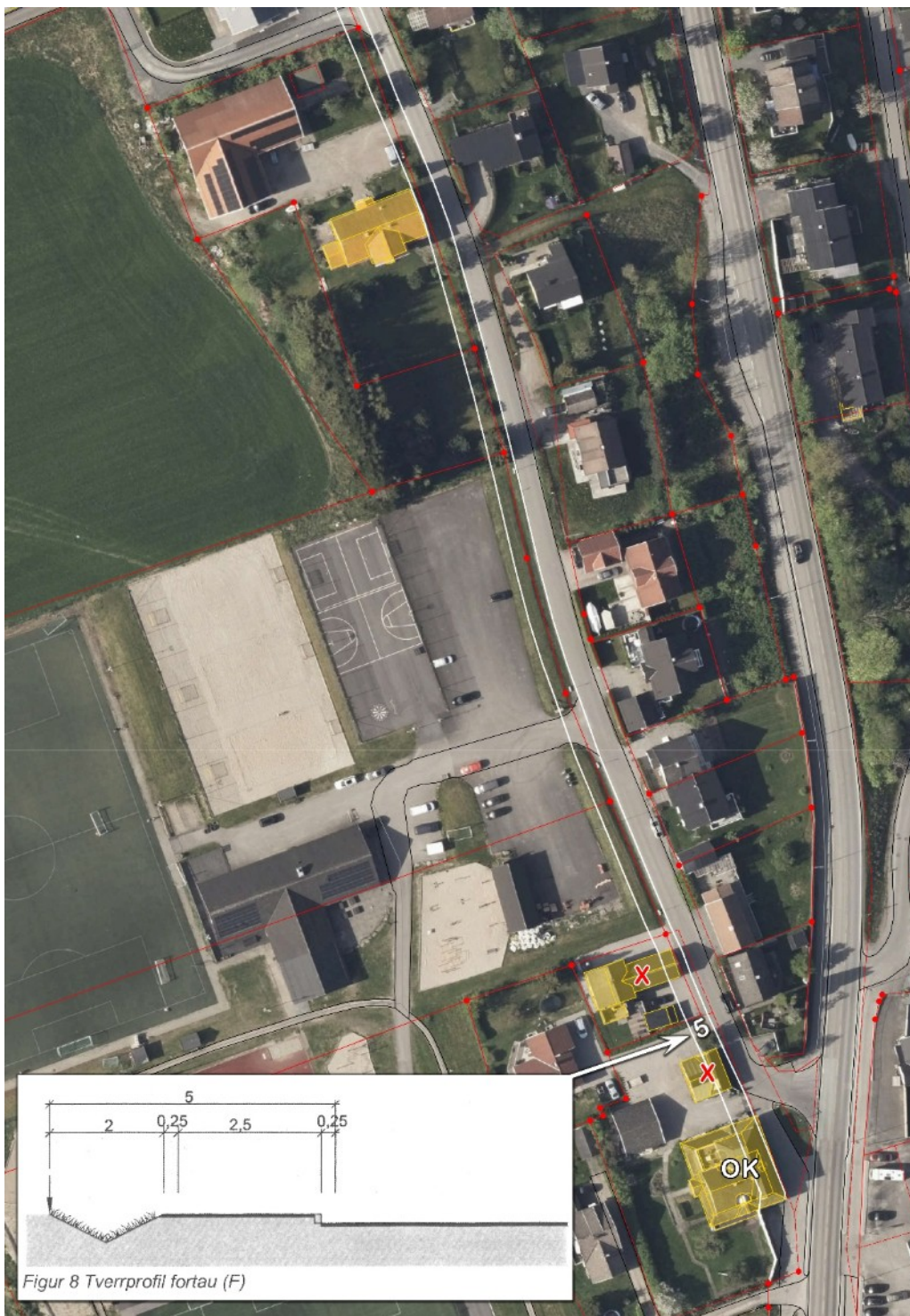
Figur 8 Tverrprofil fortau (F)

Utklippet viser er det enkelte hus langs veien som gjør at man ikke kan følge standardkravene i forhold til fortau.