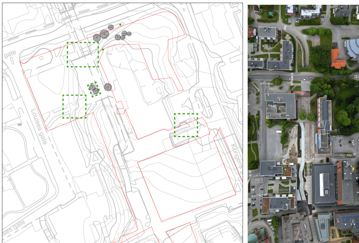
Figur 2 - illustrasjonsplan for Kverndalen nord. Grå elementer viser hva som er eksisterende. Området der nye tiltak er aktuelt er stiplet med grønn linje.