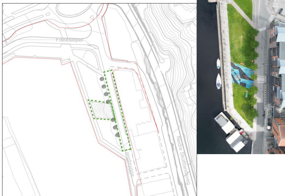
Figur 4 - illustrasjonsplan for Bryggeparken. Grå elementer viser hva som er eksisterende. Området der nye tiltak er aktuelt er stiplet med grønn linje.