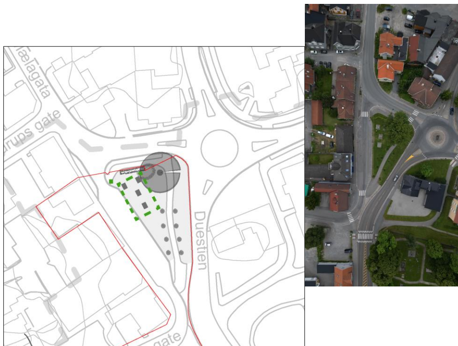
Figur 1 - illustrasjonsplan av Plesnerparken. Grå elementer viser hva som er eksisterende. Området der nye tiltak er aktuelt er stiplet med grønn linje.