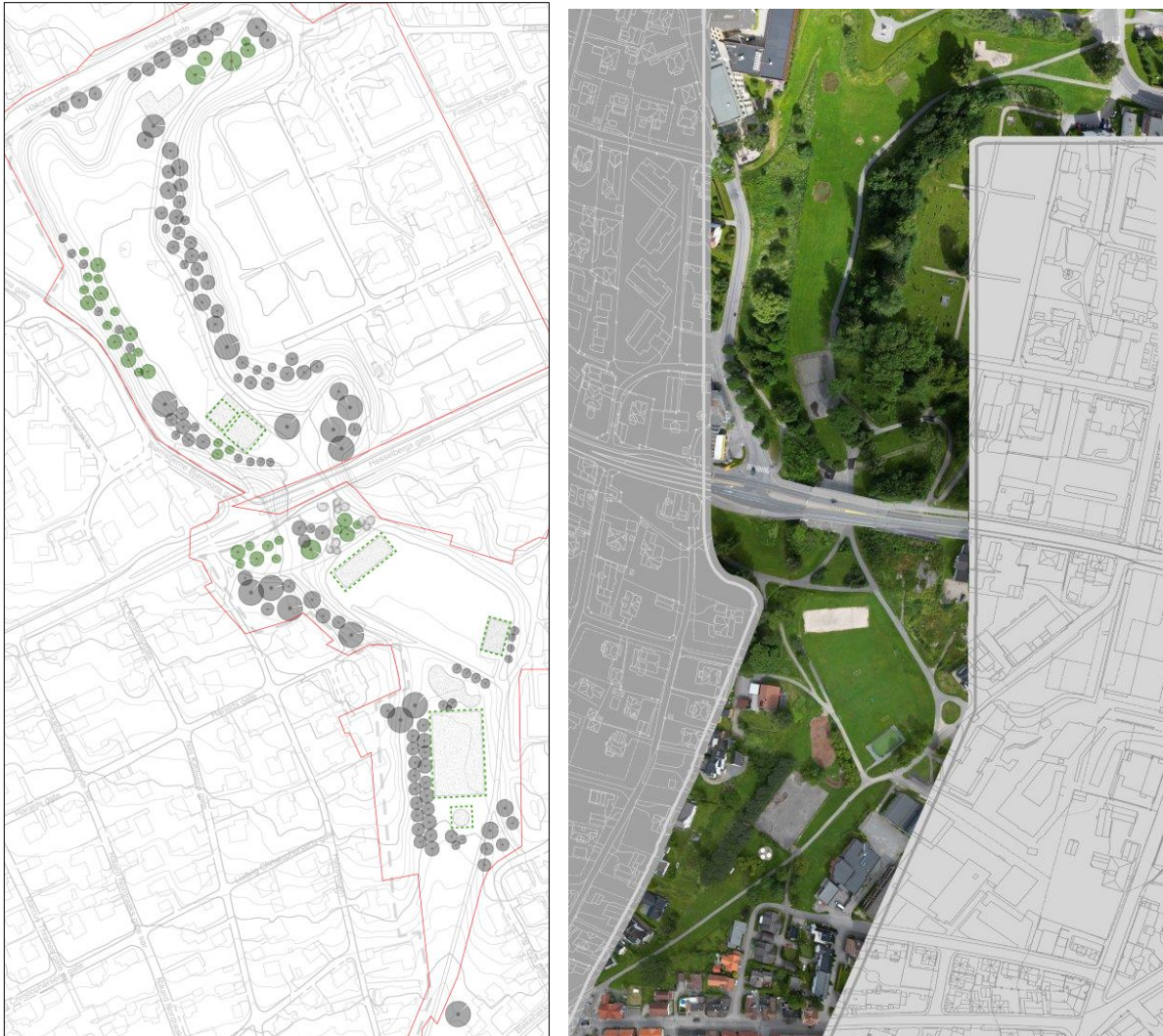
Figur 3 - illustrasjonsplan for Lundedalen (søndre del). Grå elementer viser hva som er eksisterende. Området der nye tiltak er aktuelt er stiplet med grønn linje.