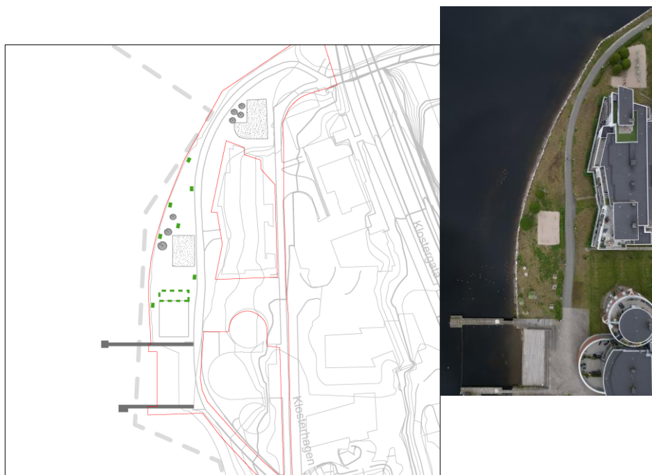
Figur 5 - illustrasjonsplan for Klosterøya vest. Grå elementer viser hva som er eksisterende. Området der nye tiltak er aktuelt er stiplet med grønn linje.

Type byrom: Park ved vannet med treningsmuligheter