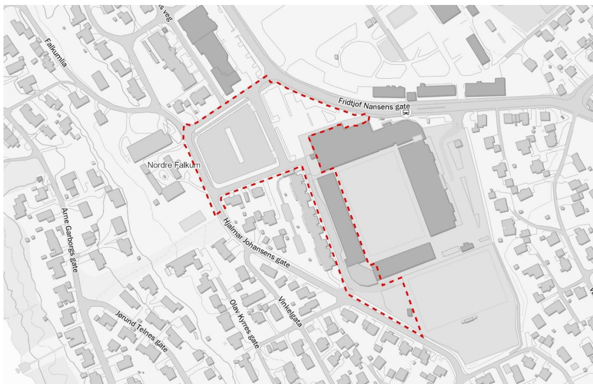
Varslingsgrense vist med rød stiplet strek.

Det er planlagt utbygging med leiligheter i to plan under dagens tribuneanlegg, med mulighet for parkeringsplasser under. Det er også planlagt for et nybygg nord for tribunen, i inntil fem boligetasjer over en høyere næringsetasje. I næringsetasjen ser man for seg å innlemme inngang til boligene, atkomst til Kiwi, et mindre næringslokale, noe parkering og en åpen gjennomgang til banen i stadionanlegget.